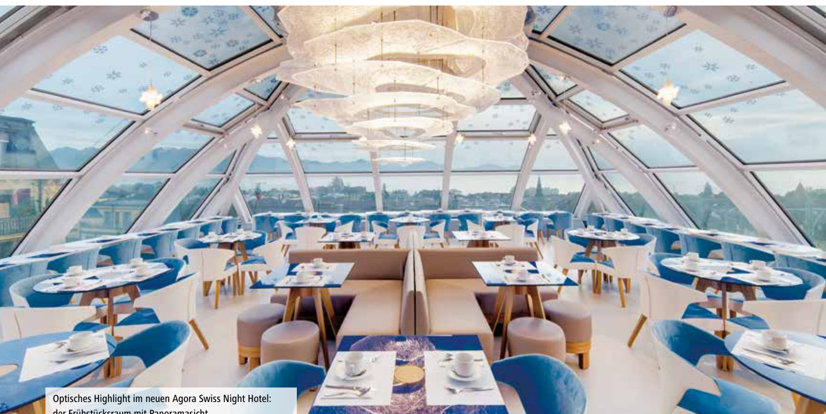
Optisches Highlight im neuen Agora Swiss Night Hotel: der Frühstücksraum mit Panoramansicht.