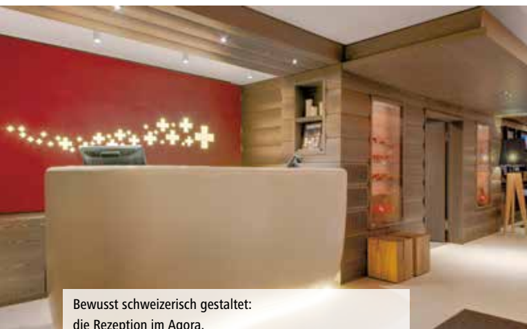
Bewusst schweizerisch gestaltet: die Rezeption im Agora.