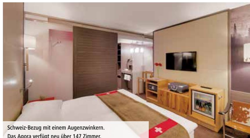
Schweiz-Bezug mit einem Augenzwinkern. Das Agora verfügt neu über 147 Zimmer.