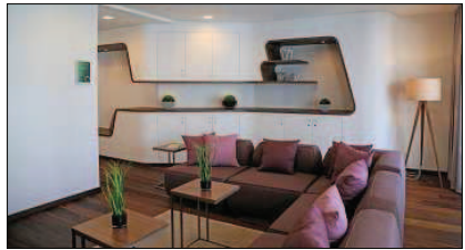
Das gemütliche Wohnzimmer steht Eltern und Geschwisterkinder ebenfalls als Rückzugsraum zur Verfügung.